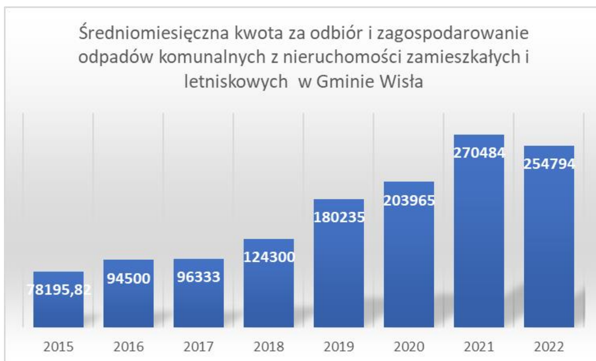
Wykres 1. Średnia miesięczna kwota za odbiór i zagospodarowanie odpadów komunalnych w Gminie Wiśła dla poszczególnych umów