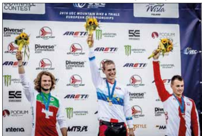
fol. mat. prasowe