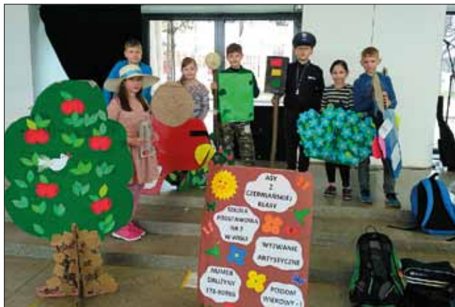
fol. Szkoła Podstawowa nr 2