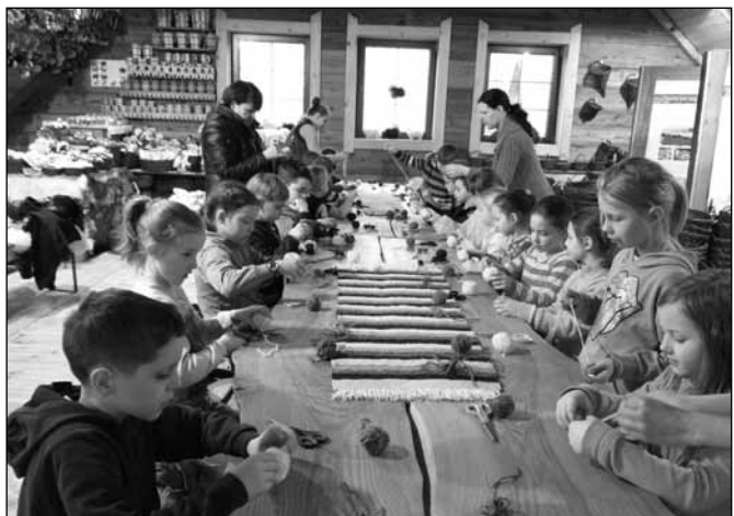
fol. Szkoła Podstawowa nr 2

Konkurencje biegowe odbyły się 9 lutego na Niemculi. Brali w nich udział uczniowie z klas IV–VI. Maluchy zaś gorąco kibicowały starszym kolegom. Natomiast konkurencje zjazdowe udało się zorganizować 3 marca. Kolejny raz, dzięki uprzejmości właścicieli wyciągu Klepki oraz Szkółce Narciarskiej „Jar-ski”, w zjazdach brali udział prawie wszyscy uczniowie z klas 0–VI. Swoje pociechy dopingowali licznie zebrani rodzice. Na zakończenie zmagania uczestnicy udali się na poczęstunek przygotowany przez Restaurację „Olimpia”. Zwieńczeniem uroczystości była dekoracja zwycięzców. (K.SZ. i L.C.)