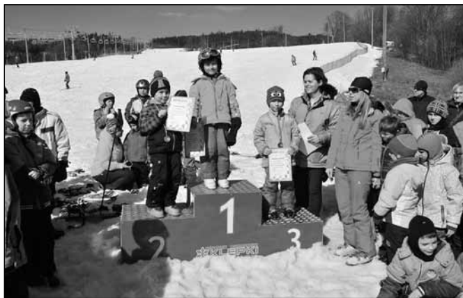
fol. Zespół Szkolno-Przedszkolny nr 2