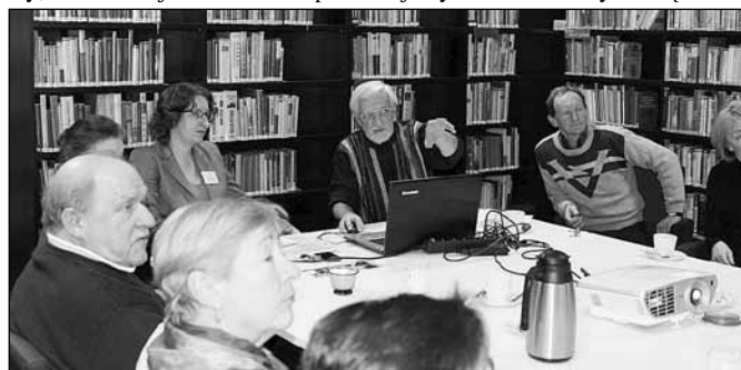
fol. MBP w Wiśle

Na wstępie zostały omówione pojęcia ładu i porządku w przestrzeni oraz układy uszeregowania obiektów architektonicznych na konkretnych przykładach i rysunkach. Zaraz wybuchła dyskusja, jak to się ma do Wisły, która miejski charakter prezentuje tylko w niektórych częściach