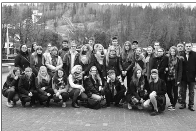
fol. Stowarzyszenie Porozumienie Pokoleń

Honorowy patronat nad przedsięwzięciem objął burmistrz Wisły Tomasz Bujok. Tradycyjnie na miejsce działań wybrano Ośrodek Wypoczynkowy „Relaks”. Celem projektu było, przede wszystkim, pogłębienie i zdobycie nowej wiedzy na temat demokracji, ustrojów politycznych, funkcjonowania Unii Europejskiej i głównych instytucji europejskich, uzmysłowienie sobie, jak ważne jest aktywne obywatelstwo oraz świadomość obywatelska i europejska wśród młodych osób, a także jak znaczącą kwestią jest uczestnictwo w wyborach na różnych szczeblach i referendum.