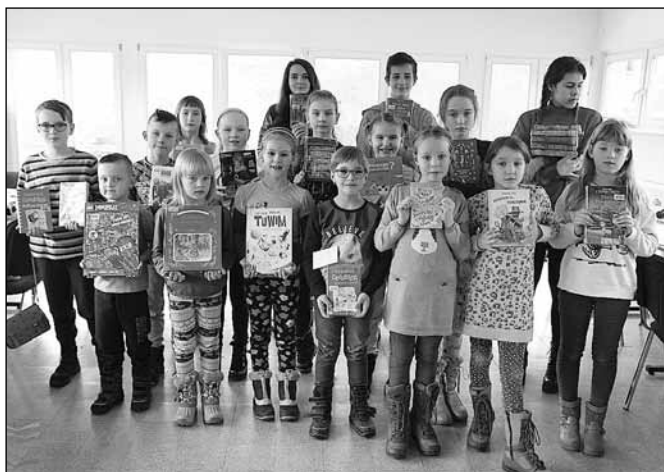
fol. MBP w Wiśle

Ostatnie spotkanie 21 lutego poświęcone było promocji książki i czytelnictwa. Podczas warsztatów kreatywności młodzieży czytelnicy z wiślańskiej biblioteki wcielili się w rolę prelegentów. Uczestnicy zajęć stanęli bowiem przed trudnym zadaniem wypromowania swojej ulubionej książki. Podczas ograniczonych czasowo wystąpień ambasadorzy poszczególnych dzieł żywo opowiadali o głównych bohaterach, fabule, stronie graficznej i cytowali swoje ulubione fragmenty. Zadanie było bardzo trudne, ale większości wypowiedzenie się na temat ulubionej literatury przychodziło z łatwością, toteż „forum młodych” należy uznać za bardzo udane. Po krótkich prezentacjach, wspólnych zabawach i poczęstunku przyszedł czas na pracę w małych grupach. Najpierw uczestnicy wymyślali slogany reklamujące książkę i bibliotekę, po czym nanosili je na tekstylne torby, których teraz będą używać do pakownia wypożyczonych w bibliotece książek.