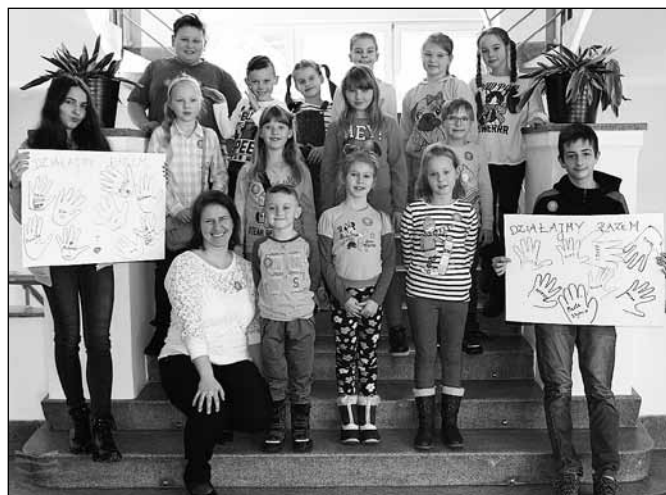
fol. MBP w Wiśle

Z okazji święta zakochanych, 14 lutego uczestnicy „Ferii w bibliotece” pochylili się nad tekstami literackimi nawiązującymi do Walentynek. Dzieci i młodzież biorąca udział w zajęciach wykonały serca z papierowej wikliny i kolorowych włóczek. W przerwie zaserwowano „zakochanym” pączki, a po poczęstunku młodzieży czytelnicy integrowali się podczas konkursów i zabaw. Z kolei 19 lutego biblioteka wzięła udział w ogólnopolskiej akcji „Dzień Bezpiecznego Internetu”, która w tym roku realizowana była pod hasłem „Działajmy razem”. Podczas trzeciego spotkania w ramach ferii młodzieży internauci ustalili wspólnie podstawowe zasady netykiety, zobaczyli materiał filmowy, rozwiązywali krzyżówki, quizy i rebusy. Był też czas na analizę materiałów edukacyjnych i zabawy ruchowe. W Polsce Dzień Bezpiecznego Internetu od