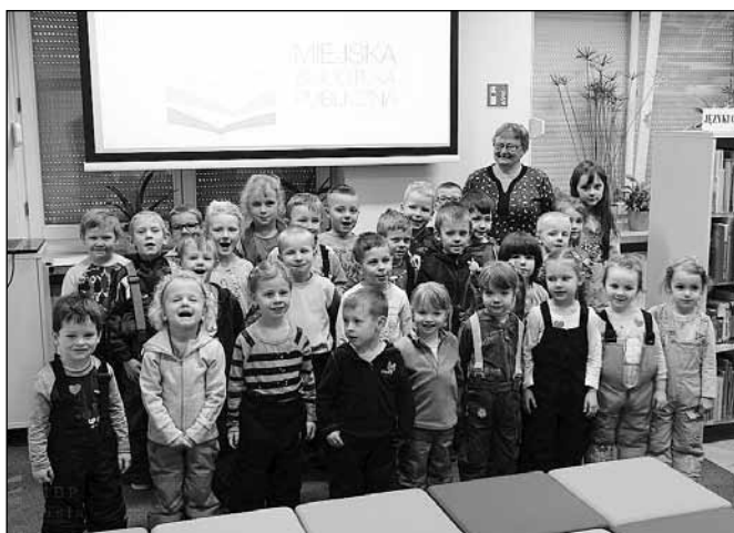
fol. MBP w Wiśle