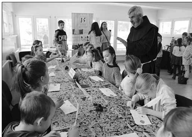
fol. MBP w Wiśle

2005 roku organizowany jest przez Fundację Dzieci Niczyje oraz Naukową i Akademicką Sieć Komputerową (NASK) – realizatorów unijnego programu Safer Internet, zaś głównym partnerem wydarzenia jest Fundacja Orange.