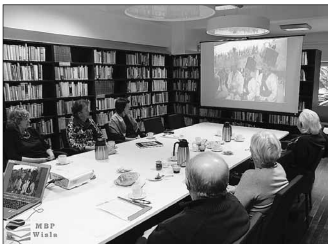
fol. MBP w Wiśle

Kolejne spotkanie grupy dyskusyjnej działającej przy Miejskiej Bibliotece Publicznej odbyło się 26 lutego. Zebrani ponownie zajęli się rokiem obrzędowym w Wiśle. Tym razem omawiano tradycje związane z okresem lata i jesieni.