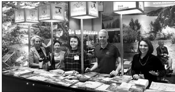
fol. UM Wisła

Wisła, wspólnie z Beskidzką 5, Powiatem Cieszyńskim, Stowarzyszeniem Rozwoju i Współpracy Regionalnej „Olza” i Jastrzębiem-Zdrój promowała się na dużym stoisku województwa Śląskiego, które było jednym z dominujących wystawców na targach.