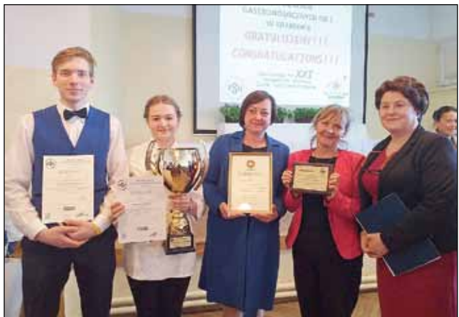
ZSGH i. W. Reymonta