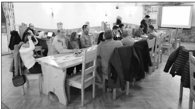
fot. Zarząd Osiedla nr 7

Przewodnicząca przedstawiła sprawozdanie za mijającą kadencję. Sprawozdanie zostało przyjęte jednogłośnie. Kolejnym punktem zebrania był wybór komisji skrutacyjnej powołanej do przeprowadzenia wyborów nowego Zarządu. Następnie przystąpiono do wybo-