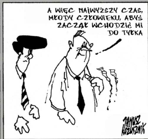
rys. Janusz Kozusznik