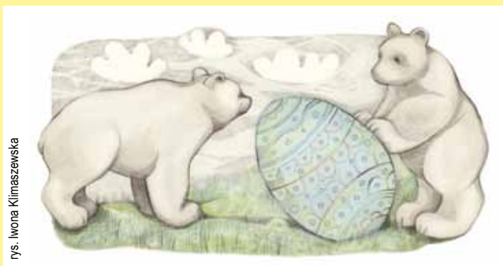
rys. Iwona Klimaszewska